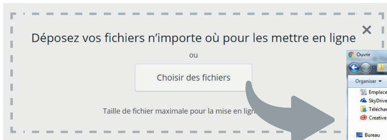
Tableau de bord > Médias > Bibliothèque > Ajouter